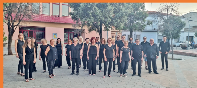
Coral Sant Esteve de Balsareny.

No hi faltará la part catalana, representada per la Polifònica i els nostres convidats especials, com són la Coral Sant Esteve de Balsareny, una coral que en els nostres inicis – amb el seu director d'aquell temps, Mn. Joan Bajona, al capdavant– ens va servir de mirall i ens va donar suport, i que durant tots aquests anys hem tingut sempre al nostre costat. Aquest any, la Coral Sant Esteve compleix el seu 60è aniversari; són seixanta anys portant els seus cants arreu de Catalunya. A la Polifònica ens complau poder celebrar junts aquest aniversari de la coral de Balsareny tot convidant-la a l'edició d'enguany del nostre festival de música coral i dansa, a Puig-reig. Esperem que aquest programa sigui del vostre interès i que ens puguem retrobar, un any més, tot gaudint del cant coral i de les ballades de sardanes. Unes activitats que la nostra Agrupació organitza des de ja fa molts anys amb el propòsit de compartir i fomentar la música del nostre país, al mateix temps que donem a conèixer la música coral d'altres països i cultures d'arreu del món.