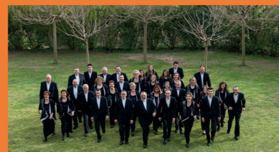
Coral Polifònica de Puig-reig.

L'organització es reserva el dret a alterar o suspendre algun dels actes per causes de força major.